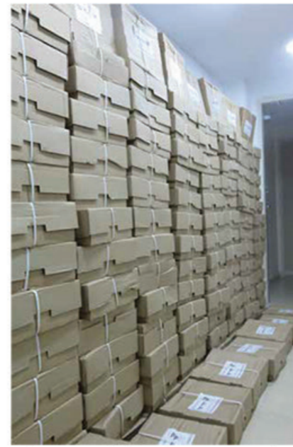
אלפי ק"ג בשר לחג לחלוקה הגדולה

לא נכביר כאן במילים, כי לא באנו כאן לשבח ארגון אשר כל מטרתו הוא לעבוד מתחת לרדאר, אך כאשר פעילות הקודש הגיעו למבוי סתום, הכתובת היחידה היא לבם הרחום של כלל ישראל - המקרים מתרבים משפחות רבות מחכות בתור, עיניהם כלות ומשוועות לעזרה, כאשר כל יום חולף הוא פיקוח נפש של ממש - ועינינו כלות עוד יותר לעזור להם, אך התקציב הנדרש בהתאם הוא אדיר ובלתי אפשרי.