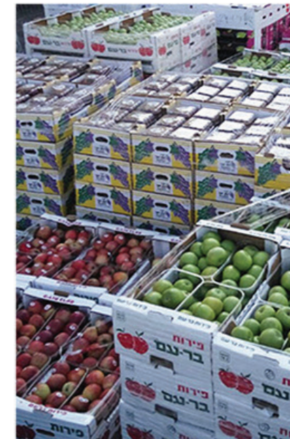
פירות וירקות לכל דצריך

אך כעבור דקה החרדה הקודמת רק התגמדה, לנגד עיני שכן האצילי פשוט פרץ בבכי בלתי נשלט, זה כבר לא הענין, לא זה מה שיעזור לי ברגע הזה, הוא הפטיר - באותו ערב ישבתי אל